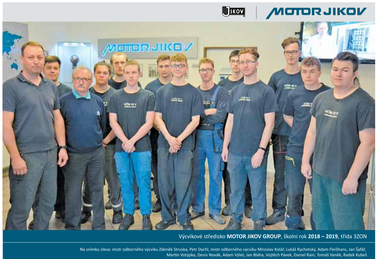
Výcvikové středisko MOTOR JIKOV GROUP, školní rok 2018 – 2019, třída 3ZON

čínských investic do Česka mediálně nejdílejší. Stejně jako v byznysu i ve sportu dřímá v Číně i díky obrovskému množství lidí velký potenciál,“ řekl ke schůzce Miroslav Dvořák. Čínský velvyslanec Čang Ťien-minem v minulosti vedl na čínském ministerstvu zahraničních věcí odbor pro tlumočení, vyslán byl také na čínskou ambasádu do Spojených států. Působil jako tlumočnick čínských prezidentů či premiérů.