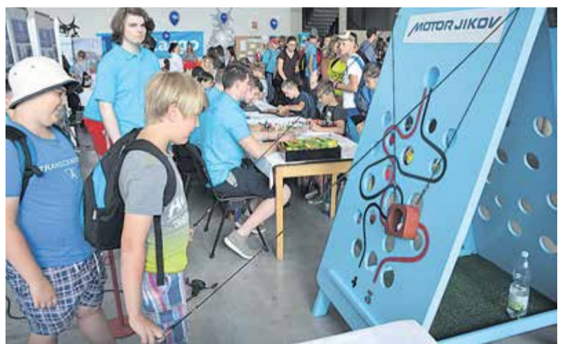
Pohybovou koordinaci si mohli otestovat návštěvníci stánku firmy, kdy za pomoci na sobě nezávislých táhel měli za úkol provést golfový míček po určené trase v co nejkratším čase.