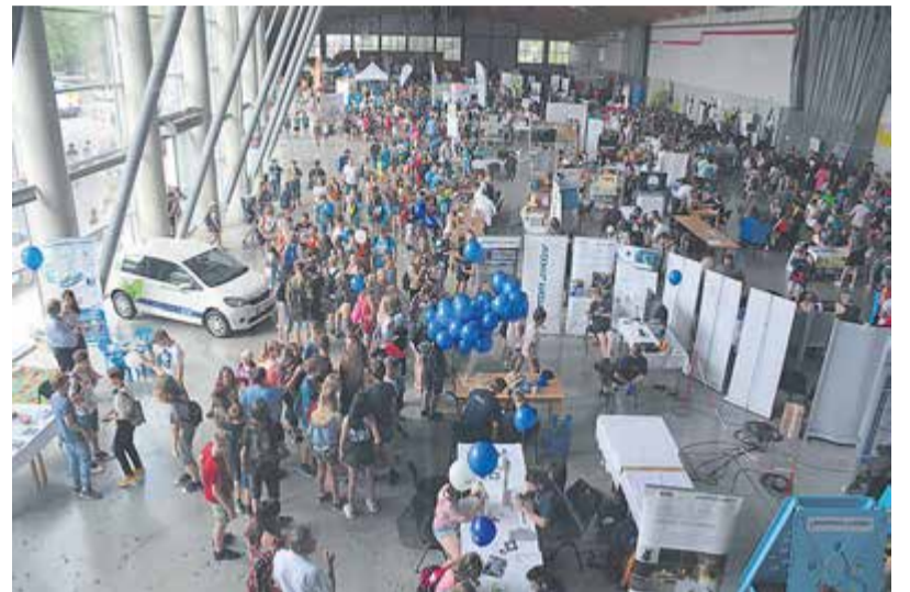
Plno! Jen několik minut po zahájení akce se pavilon T českobudějovického Výstaviště zaplnil dětmi. Stovky malých návštěvníků obsypaly všech více než 270 stánků akce. V odpoledních hodinách vystřídal školní exkurze rodiče s dětmi.