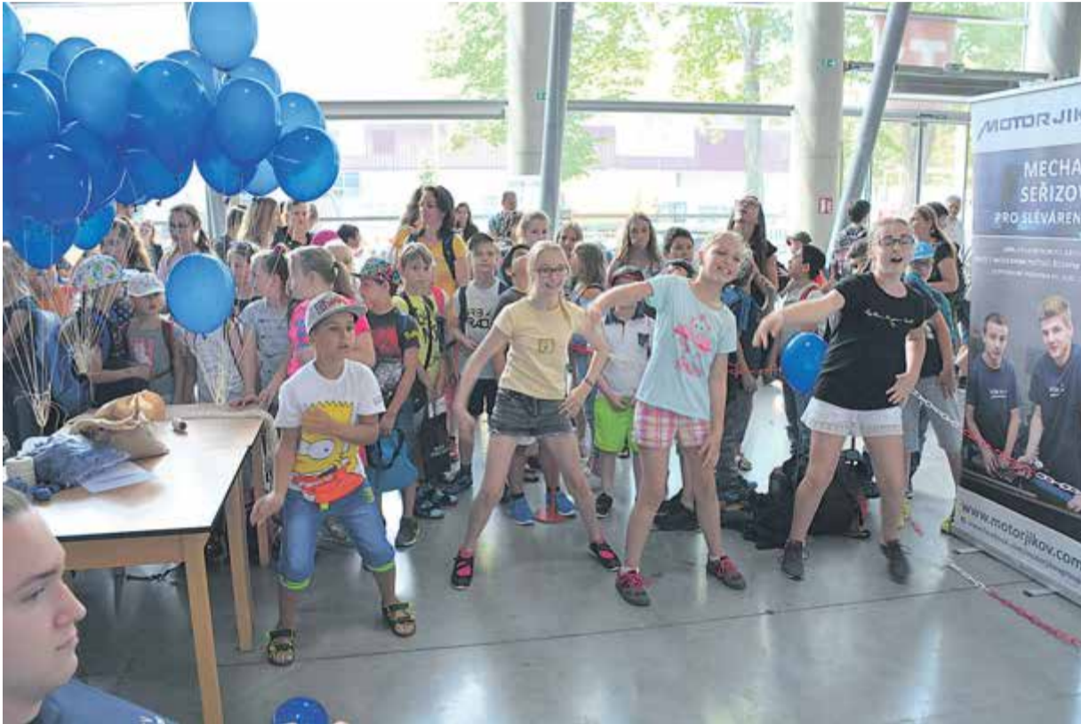
O zábavu bylo v expozici MOTORU JIKOV postaráno. Děti si mohly vyzkoušet skládání rámečků ITEM, puzzle nebo otestovat pohybové nadání při hře na videoherní konzoli, která snímá pohyb až čtyř hráčů najednou (na snímku).