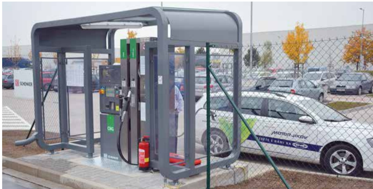
Oboustranný výdejní stojan zajišťuje přístupnost plnicí stanice z uzavřeného areálu společnosti DB Schenker i z částečně veřejně přístupného parkoviště.

Společnost Schenker spol. s r. o. počítá s návratností investice do několika let. „Spočítané jsme to měli na tři roky, ale