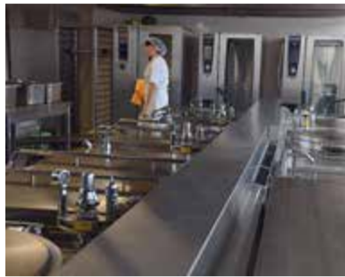
Nové vybavení kuchyně slouží kuchařkám od léta.