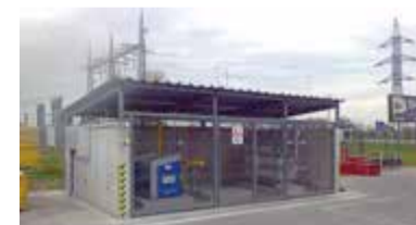
Plnicí stanice MJ Variant 2K–840 v areálu slovenské firmy PERI Slovakia s.r.o. funguje od listopadu.

Společnost PERI s.r.o. je významným výrobcem bednění a lešení na Slovensku a patří do stejné nadnárodní skupiny PERI jako