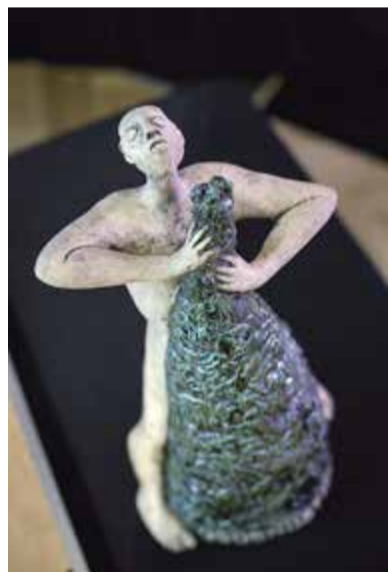
Sošku pro oceněnou Osobnost HR 2015 vytvořil sochař Daniel Pešta.

Je mi 39 let, bydlím ve Strakonici, jsem ženatý a mám dvě malé děti, které chodí do mateřské školy. Vystudoval jsem Ekonomiku a management v angličtině na Provozně ekonomické fakultě České zemědělské univerzity v Praze. Volný čas trávím většinou právě s dětmi při jejich oblíbených aktivitách. Pokud se najde volná chvíle, rád vyrazím na projíždky na horském kole.