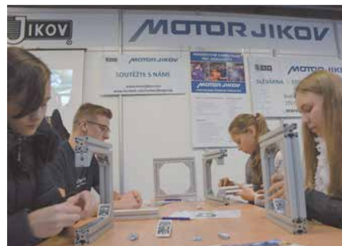
U stánku MOTORU JIKOV na výstavě Vzdělání řemeslo si mohli návštěvníci vyzkoušet i montáž rámečků z hliníkových profilů ITEM, které se využívají při stavbě jednoúčelových strojů.