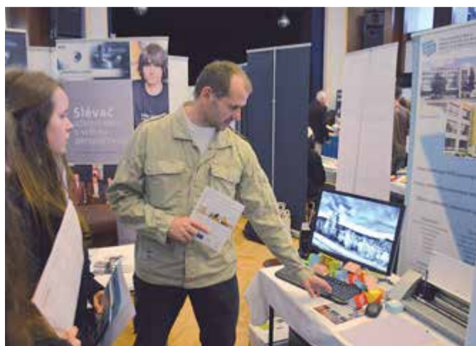
MOTOR JIKOV vystavuje na burzách škol vždy v sousedství partnerských škol, na snímku z Písku vedle Vyšší odborné školy, Střední průmyslové školy a Střední odborné školy řemesel a služeb, Strakonice.