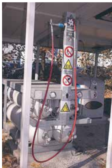
Plnicí stanice MJ Variant 1k – 560 l ve slovinském městě Kranj je složena z plnicí stanice MJ Compact 05 o výkonu 5 m 3 /h a vysokotlakého zásobníku o objemu 560 l