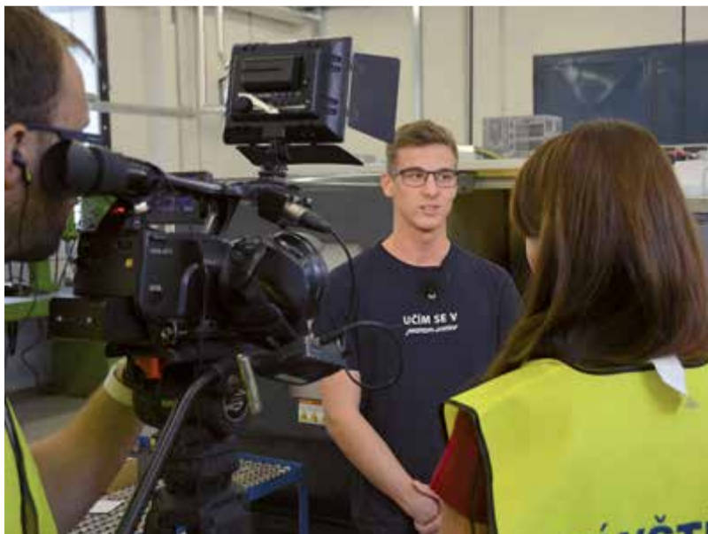
Před kamerami Jihočeské televize se ocitli učni Vyšší odborné školy, Střední průmyslové školy automobilní a technické ve výcvikovém středisku MOTOR JIKOV GROUP.

Před kamerou Jihočeské televize se opět ocitli učni výcvikového střediska MOTOR JIKOV v Českých Budějovicích. Jihočeská hospodářská komora totiž připravila unikátní projekt na podporu popularizace techniky především v očích rodičů. V sérii motivačních reportáží představí učni a zaměstnanci MOTORU JIKOV profesi mechanik – seřizovač.