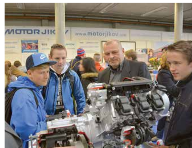
Na veletrhu Vzdělání a řemeslo firma vystavovala jako partner VOŠ, SPŠ automobilní a technické České Budějovice.

Vzdělání a řemeslo je nejširší přehlídkou středních škol, učilišť, VOŠ a dalších typů škol v celé České republice, který aktivně oslovuje odbornou veřejnost, žáky, studenty i rodiče. Výstava je stejně jako burzy škol určena zejména žákům posledních ročníků základních škol, kteří se rozhodují o svém dalším studiu a následném uplatnění v životě.