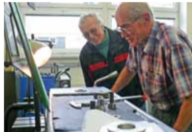
V rámci exkurze do výroby se zájemci podívali i do prostor učňovského střediska MOTOR JIKOV Strojírenská a.s.