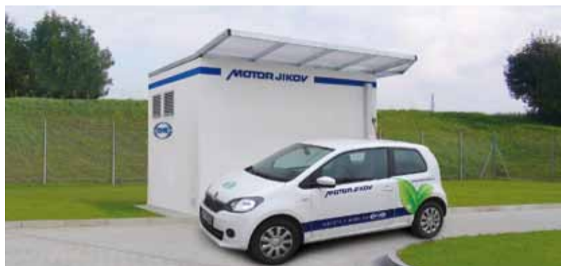
Plnicí zařízení MJ Variant Plus.

V kategorii dopravních inovací soutěže Český energetický a ekologický projekt 2013 se ucházelo o hlasy veřejnosti CNG plnicí zařízení MOTOR JIKOV MJ Variant Plus. Hlasovalo se začátkem listopadu.