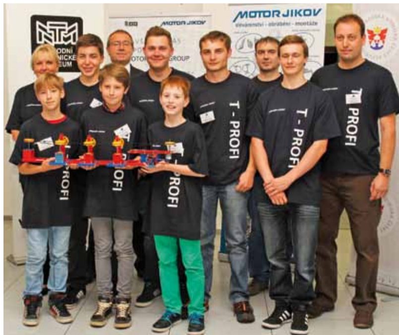
Společný tým MOTORu JIKOV, Střední průmyslové školy automobilní a technické České Budějovice a Základní školy Nové Hradky skončil v soutěži druhý.

Netradiční a v mnoha ohledech unikátní akce Talent pro firmy T-PROFI 2014, jejímž mottem bylo „nápad – zručnost – zábava“, podpořil MOTOR JIKOV GROUP. Do Národního technického muzea v Praze díky němu dorazil soutěžní tým složený ze šikovných dětí páté třídy novohradské základní školy a studentů druhého ročníku SPŠ automobilní a technické České Budějovice.