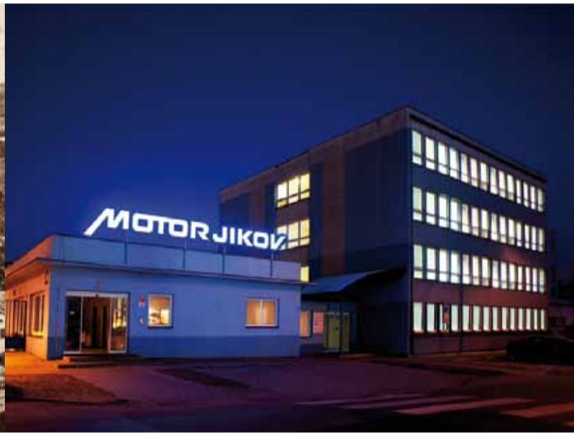
Sídlo společnosti MOTOR JIKOV Group a.s.