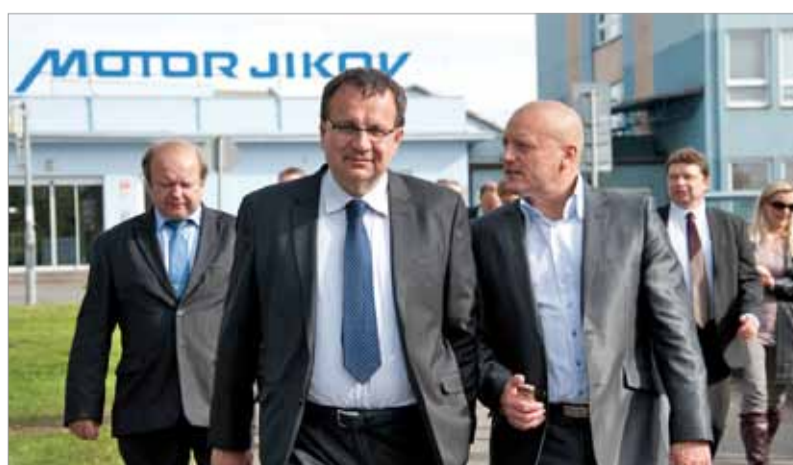
Ministr průmyslu a obchodu Jan Mládek navštívil MOTOR JIKOV na začátku října.