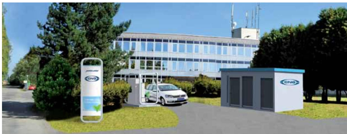
Vizualizace veřejné plnicí stanice na stlačený zemní plyn CNG v Jindřichově Hradci.

„O CNG je v Jindřichově Hradci velký zájem jak ze strany jednotlivců, tak firem a společností. Namátkou například České pošty, pekárny DK Open nebo společnosti AGRO-LA, ale i dalších firem a institucí, z nichž některé o pořízení vozů na CNG uvažují a dosud váhaly například právě z důvodu nižší dostupnosti tankování. Předpokládáme, že nová veřejná stanice, navíc velmi dobře dostupná z hlavní silnice, atraktivitu CNG