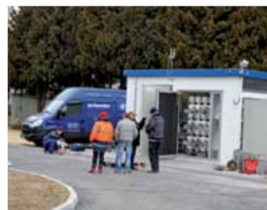
Instalace kontejneru s technologií CNG

Ve srovnání s benzínem jsou náklady na provoz CNG aut až o 50 % nižší. Kilometr jízdy nás vyjde asi na korunu. V ČR dnes jezdí na CNG téměř 6 tisíc vozidel, k současným 49 stanicím by mělo do roku 2015 přibýt kolem 35 dalších stanic. Odborníci dokonce očekávají, že v roce 2020 by Česká republika měla mít už kolem 400 CNG stanic.