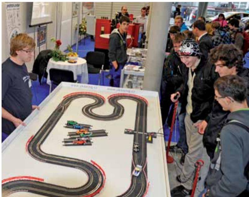
Magnetem expozice byla autodráha popularizující využití stlačeného zemního plynu CNG v dopravě.

Devatenáctý ročník výstavy se konal stejně jako v předchozím roce za podpory projektu Úspěšná mládež CZ-AT. Na 150 vystavovatelů z Čech a Rakouska zde prezentovalo učební obory, metody a pomůcky pro vzdělávání.