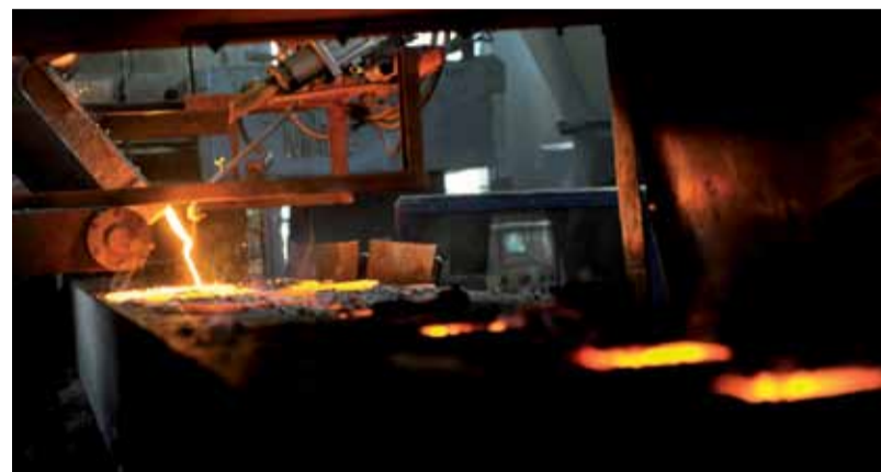
Linka kontinuálního liti

MOTOR JIKOV Slévárna a.s., divize Slévárna litiny, vyrábí odlitky z šedé a tvárné litiny zejména pro automobilový průmysl, včetně kardanových spojek, komponent do průmyslových převodovek, stabilizátorů a brzdových bubnů i jeřábových systémů. V roce 2014 plánuje další navýšení ročního obrátu o 10 milionů korun.