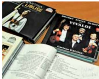
Vzácný podpis od sopranistky Gabriely Beňáčkové na CD bookletu.

roslav Dvořák. Byly pro mne vždy svátkem a rád jsem využíval příležitosti popovídat si například s Jitkou Zelenkovou, Karlem Vágnerem, Ivanem Mládkem, Jiřím Pavlicou nebo Lubomírem Brabcem a sopranistkou Gabrielou Beňáčkovou. K posledním jmenovaným mám takovou úsměvnou historku, kdy jsem si na setkání s nimi přinesl z mé sbírky CD s jejich nahrávkami, a dodnes slyším z úst pana Brabce větu: „Bože, to jsem netušil, že jsem toho tolik nahrál...“ Moc rád na to vzpomínám.