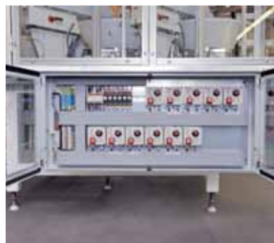
Ukázka konstrukčního hi-tech provedení rozvaděče z dílny divize Jednoučelové stroje společnosti MOTOR JIKOV Fostron a.s. Rozvaděče jako nedílná součást elektroinstalací vykonávají celou řadu operací. Zákazníci oceňují nejvyšší technickou úroveň, kvalitu a moderní design.

„V rámci výroby rozvaděčů zajišťujeme komplexní proces od návrhu, přes vyhotovení kompletní projektové dokumentace v ePLAN, vlastní výrobu rozvaděče včetně programování až po revizní činnost. Roz-