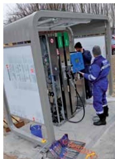
Oživování výdejního stojanu CNG