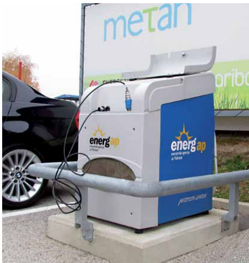
Jedna z instalací plnicí jednotky MJ Compact 05 ve Slovinsku