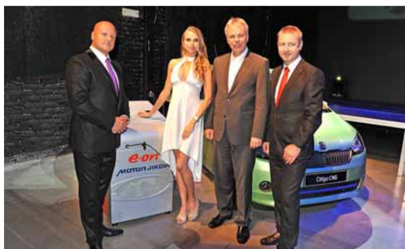
Slavnostní představení inovativních produktů na večeru PRODUKTOVÝCH IN.OVACÍ v Praze.

„Každoročně se sejde celá řada zajímavých projektů a byla by obrovská škoda, kdyby vše skončilo jen příjemným gala-večerem a předáním cen. Z toho důvodu jsme se rozhodli uspořádat akci pod názvem PRODUKTOVÉ IN.OVACE, na které jsme veřejnosti představili skutečně realizované produkty a služby, které si potenciální zákazníci mohou pořídit,“ uvedl