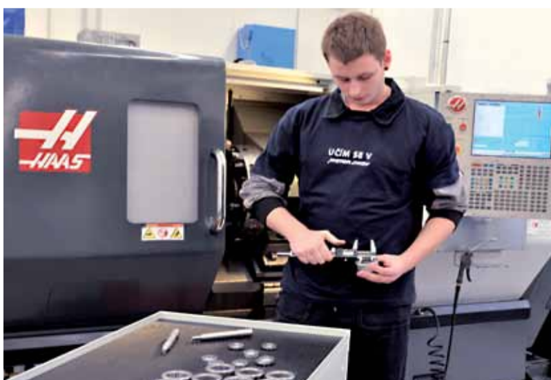
Moderní výcvikové středisko poskytuje zázemí pro výuku technických oborů.

Účastníci diskuze u kulatého stolu se shodli, že oba systémy mají svá pro a proti a je přínosné přijímat ověřené zkušenosti od svých přeshraničních partnerů.