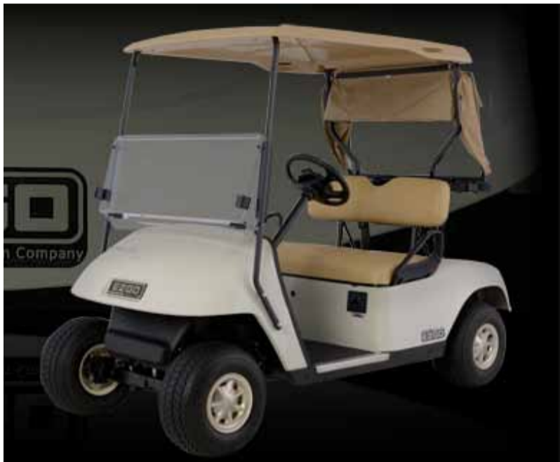
Golfový vozík značky E-Z-GO