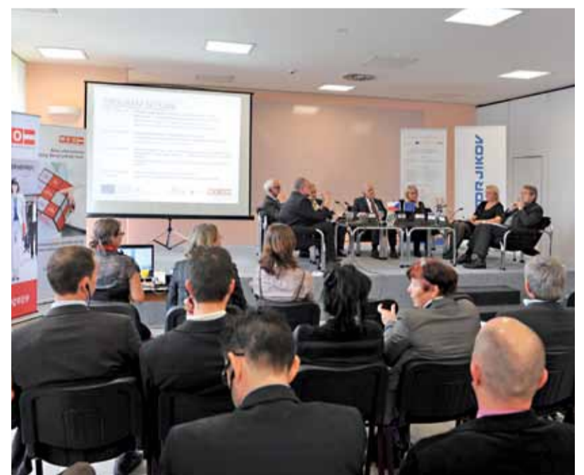
Zástupci úřadů, škol a firem z Čech a Rakouska diskutují u kulatého stolu o problematice získávání kvalifikovaných pracovníků v řemeslných oborech.

„Školy dnes, ve spolupráci s partnerskými firmami, o studenty doslova bojují. Budoucí moderní výuková střediska s moderním vybavením, aby nalákaly co nejvíce žáků. Všichni si uvědomujeme význam a sílu vzájemné spolupráce, abychom dokázali ve školách vychovat takové absolventy, které firmy potřebují,“ říká ředitel VOŠ, SPŠ Automobilní a technická České Bu-