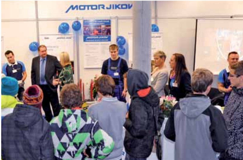
Expozice MOTOR JIKOV GROUP na výstavě Vzdelání a řemeslo

Burza škol je určena především pro žáky posledních ročníků základních škol, kteří hledají informace, které jim pomohou pro rozhodnutí při první volbě povolání. Na to, co je zajímavé, se mohou zeptat přímo zástupců středních škol a jejich partnerských firem, které se na výstavě prezentují.