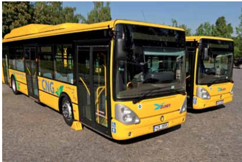
Stanice CNG bude vybavena koncovkou NGV 1 pro plnění osobních a užitkových automobilů i koncovkou NGV2 pro nákladní vozidla a autobusy.

Technologické zařízení renomovaného německého výrobce Schwelm Anlagen-technik, GmbH, který má za sebou po Evropě už více než 550 podobných realizací, dodává na český trh MOTOR JIKOV Strojírenská a.s. Soběslav. Ta bude