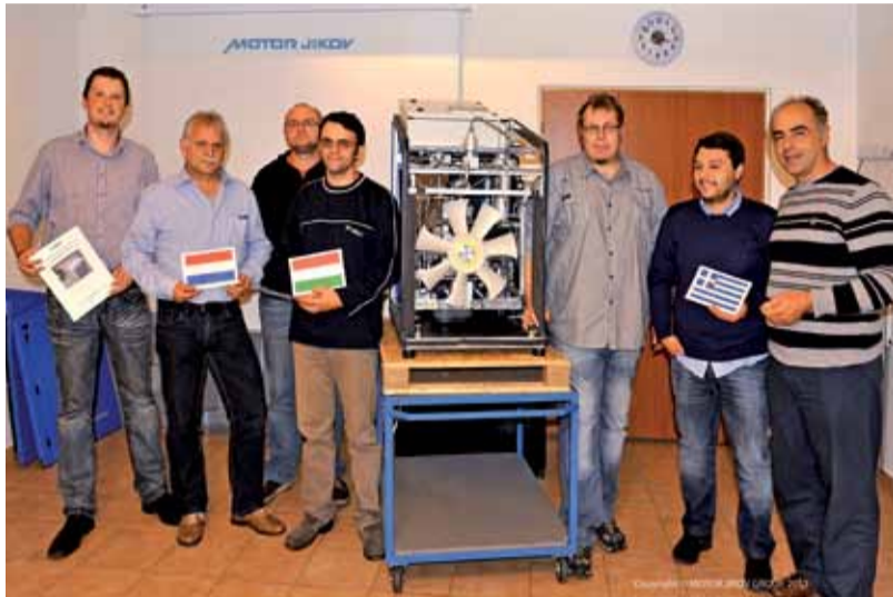
Tým techniků z pěti evropských zemí na Prvním mezinárodním servisním kursu pro techniky plnicího zařízení MJ Compact 05. Mezinárodní tým tvoří kromě Čechů odborníci z Řecka, Nizozemska, Maďarska a Rakouska.

Výroba plnicích stanic pro CNG je projektem, do kterého MOTOR JIKOV Strojírenská a.s. vkládá velkou energii. Enormně roste zájem o alternativní zdroje pohonu motorových vozidel. A právě stlačený zemní plyn je jednou z neekonomičtějších a neekologičtějších variant vůbec.