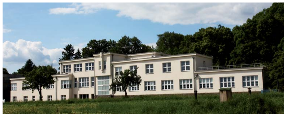
Jedna z budov Dětské psychiatrické léčebny Opařany

Dětská psychiatrie existuje a existovat bude a společnost tento obor potřebuje. Přesto je stále trochu na pozadí zájmu, nemá odpovídající popularitu a lidé pak mají zkreslené představy. I když oproti začátkům v devadesátých letech, kdy byl obor psychiatrie tabuizován, jsme se již hodně posunuli správným směrem. Mým velkým přáním je propojit pojem dětská psychiatrie s konkrétním dnem, kdy se jí bude dostávat zvýšené pozornosti a podpory. Stejně jako jsou dny na podporu leukémie, transplantace kostní dřeně, akce Stonožkové týdny,