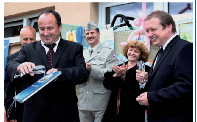
Knihu, vydanou ke 110. výročí založení firmy MOTOR JIKOV Group a.s, pokřtili Vladimír Tošovský, ministr průmyslu a obchodu, a Milan Binder, autor knihy.

Dětská psychiatrická léčebna Opařany je největší psychiatrickou léčebnou v České republice. Tímto zařízením uprostřed krásné přírody v okrese jihočeského města Tábora, projde ročně více než 600 pacientů ve věku od 3 do 18 let. Léčebna nabízí strukturovanou a komplexní péči jak pro akutní stavy, tak i pro stavy vyžadující dlouhodobější hospitalizaci.