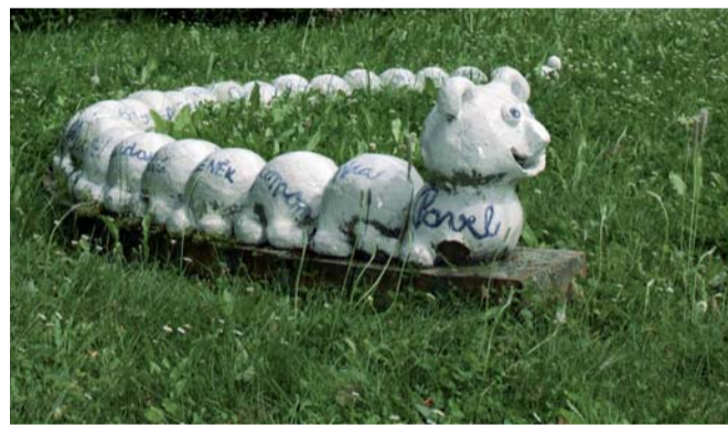
Hned za branami areálu vítá děti veselá stonožka.

Podpora sponzorů je pro nás nesmírně důležitá a my si vážíme všech, od nejdrobnějších až po ty velké, jako je například společnost MOTOR JIKOV Group a.s. Psychiatrie není oborem, který by sponzory přitahoval sám o sobě, spíše naopak, proto musíme vynakládat více úsilí. Žádné zařízení našeho typu si nemůže dovolit být bez těchto přátel. Nejen z důvodu materiálního, ale naše děti mají díky jejich podpoře větší možnosti kulturního vžití, seznamují se s novými lidmi a prostředím. To pomáhá zjemnit jejich zdravotní a osobní problémy. Mým