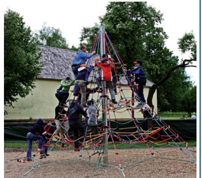
Děti dostaly ke Dni dětí novou provazovou prolézačku.