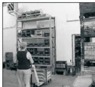
Záběry z nových výrobních a skladových prostor v Knežskodvorské ulici v Českých Budějovicích, ve kterých od června letošního roku působí společnost MOTOR JIKOV Strojírnská a.s., po ukončení podnikání ve Vodňanech.