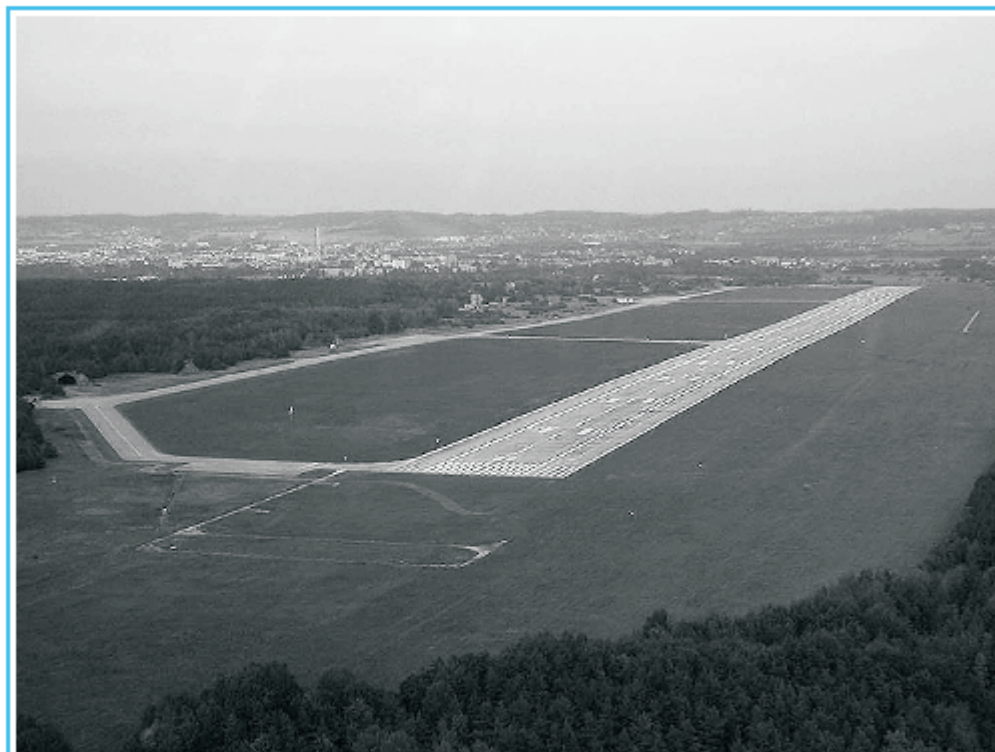
Letiště v Plané u Českých Budějovic