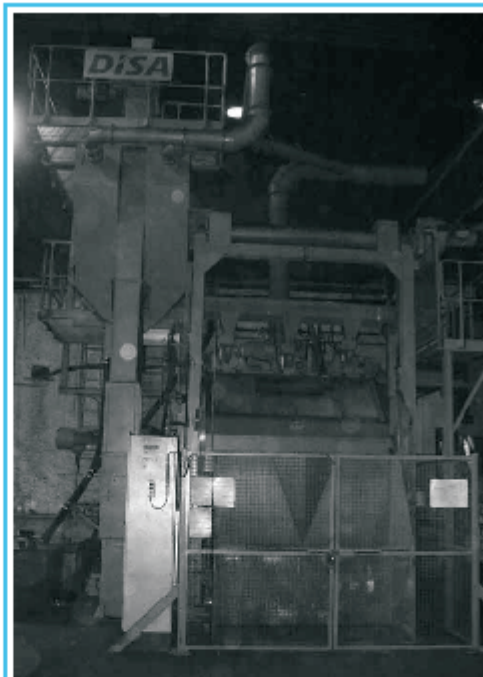
V provozu je nový tryskací stroj. Divize Slévárna litiny disponuje od května novým tryskačem s polygonním bubnem. Důležitá tak k modernizaci slévárny, která napomůže snížení pracnosti při úpravě a snížení ztrát ve výrobě.