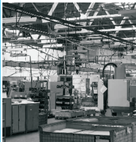
Pohled do haly, kde dojde v letních měsících letošního roku k celkové rekonstrukci střechy.

„Od této investiční akce, která by měla být kompletně dokončena v následujících dvou letech, tedy do konce roku 2009, si slibujeme značnou úsporu ve spotřebě energií a zlepšení pracovního prostředí,“ dodal Jiří Macháček.