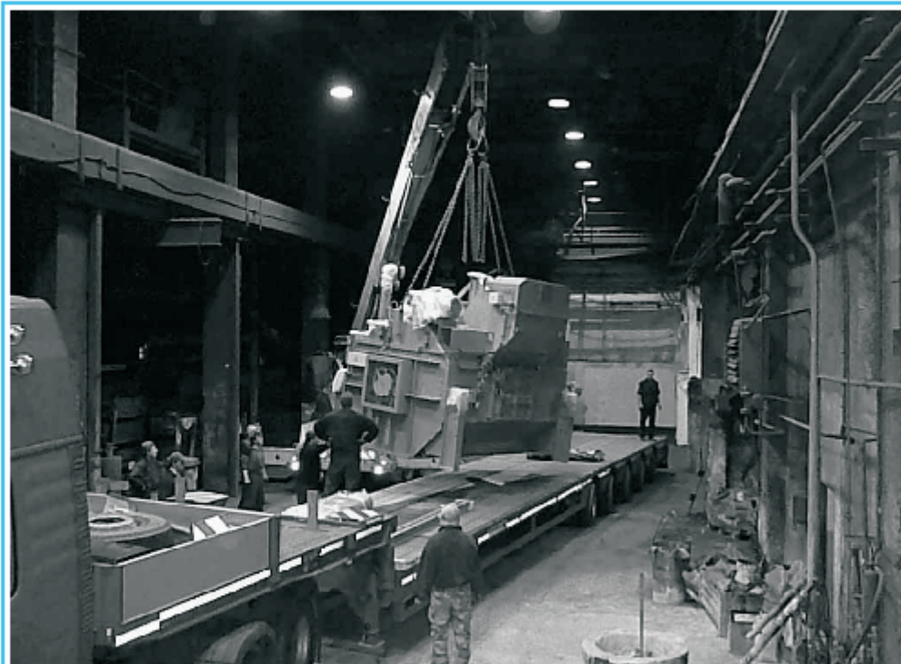
Záběry z instalace nového tryskacího stroje, který zakoupila společnost MOTOR JIKOV Slévárna litiny a.s. v dubnu letošního roku. Uvedení zařízení do chodu zajistila dodavatelská firma DISA Příbram.