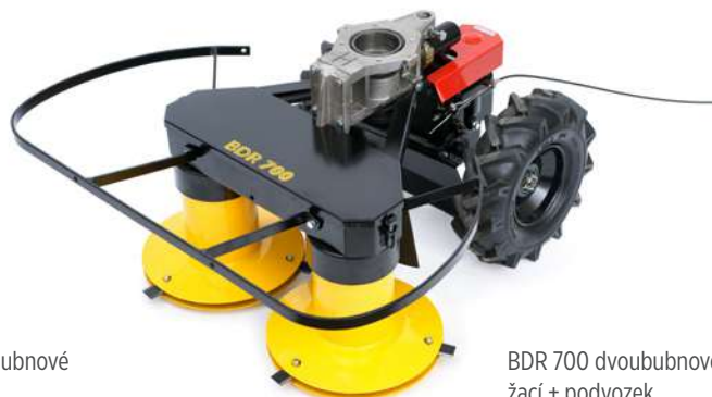
BDR 700 dvoububnové žací + podvozek