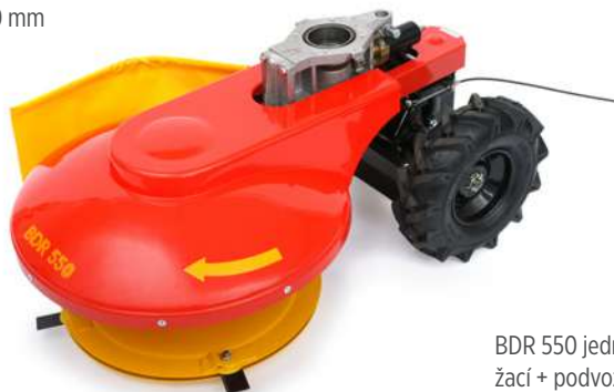
BDR 550 jednobubnové žací + podvozek

Pro pohonné jednotky s odstředivou spojkou Ø 80 / 120 mm