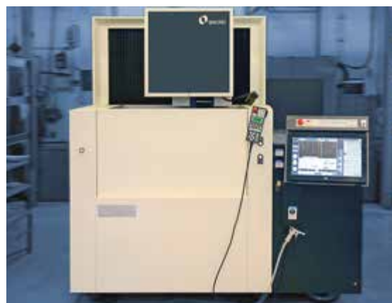
Nová drátová řezačka MAKINO U6 H.E.A.T. umožňuje řezání vyšších dílů. Pořízení stroje bylo součástí projektu Potenciál č. 4.2 PT03/1140 Rozšíření TVC MOTOR JIKOV Slévárna a.s.

Hlavní rozdíl v porovnání se starým strojem je možnost řezání vyšších dílů. Stávající má zdvih v ose Z 260 mm, nová 420 mm. Nová drátová řezačka MAKINO U6 H.E.A.T. umožní navýšení výrobních kapacit. Stroj je vybaven funkcí H.E.A.T ( High Energy Applied Technology), což je nová technologie pro zajištění nejvyšších rychlostí řezání a provozních rychlostí v elektrojiskrovém řezání.