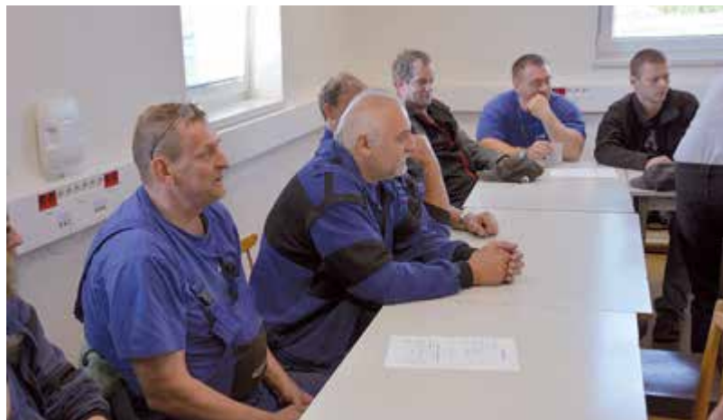
Vzdělávací aktivity se týkaly jak dělnických profesí, tak řídicích pracovníků.

PODPORUJEME VAŠI BUDOUCNOST www.esfcr.cz