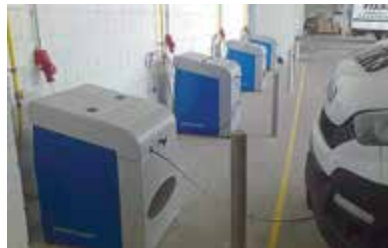
O plnění flotily pěti vozidel Iveco Daily se staršími plnicími MJ Compact 05 z produkce MOTOR JIKOV Strojírenská a.s.

Zařízení MJ Compact 05 je určeno pro přímé plnění vozidla stlačeným zemním plynem. Jedná se o nejjednodušší a nejrychlejší instalaci spojenou s nejnižšími investičními náklady. MJ Compact 05 se vyznačuje nízkými provozními a servisními náklady. Stanice obsahuje třístupňový, olejem mazaný kompresor JIKOV s výkonem 5 m 3 /h a maximálním výstupním tlakem 250 bar.