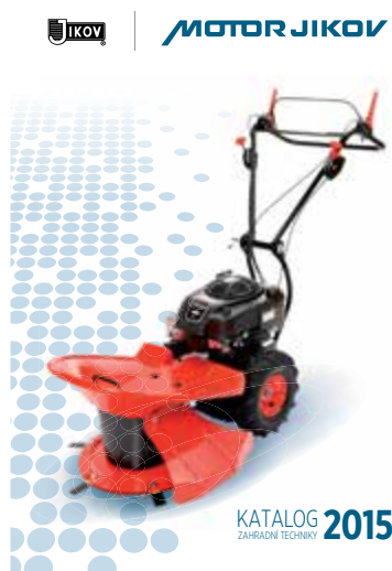
Nový samostatný katalog výrobků značky MOTOR JIKOV, který je ke stažení na www.motorjikov.com .

MOTOR JIKOV GREEN a.s. se specializuje na distribuci zahradní techniky vlastní výroby a na produkty celosvětově největšího výrobce motorů pro zahradní techniku Briggs & Stratton pod značkami MURRAY, SNAPPER, SIPMLICITY a CANADIANA. Nabízí také zahradní techniku třetího největšího světového výrobce japonské společnosti YAMABIKO pod značkami ECHO a SHINDAIWA.