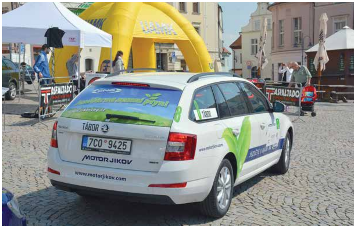
Škoda Octavia G-TEC v barvách MOTORu JIKOV byla jediným českým vozem ve startovním poli.

Výhodou New Energies Rallye Český Krumlov je skutečnost, že se závodu může zúčastnit každý držitel řidičského průkazu, který vlastní elektromobil, auto s hybridním pohonem nebo vozidlo poháněné CNG, LPG, etanolem, metanolem či vodíkem.